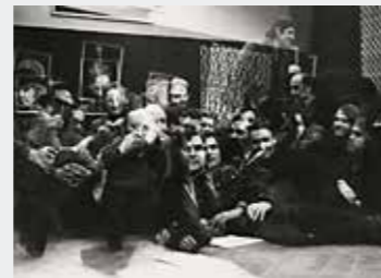
↑ 1. A Supports/Surfaces csoport első múzeumi kiállítása. ARC, Párizs, 1970. szeptember 13. - október 15.