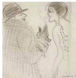
10. Hölgynek tüzet adó férfi, 1925, MNG