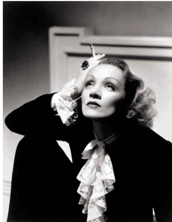
2. Marlene Dietrich, 1930 körül