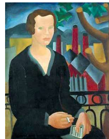
15. Christopher Wool: Fiatal nő cigarettával, 1927