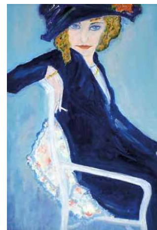
14. Leo Gestel: Cigaretttázó nő