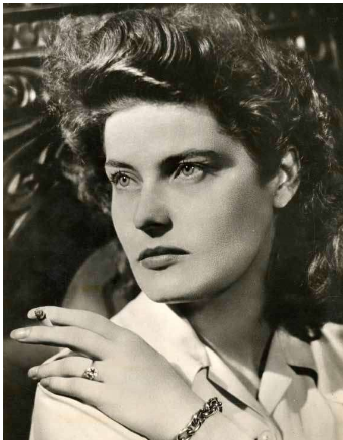
3. Karády Katalin, 1930 körül