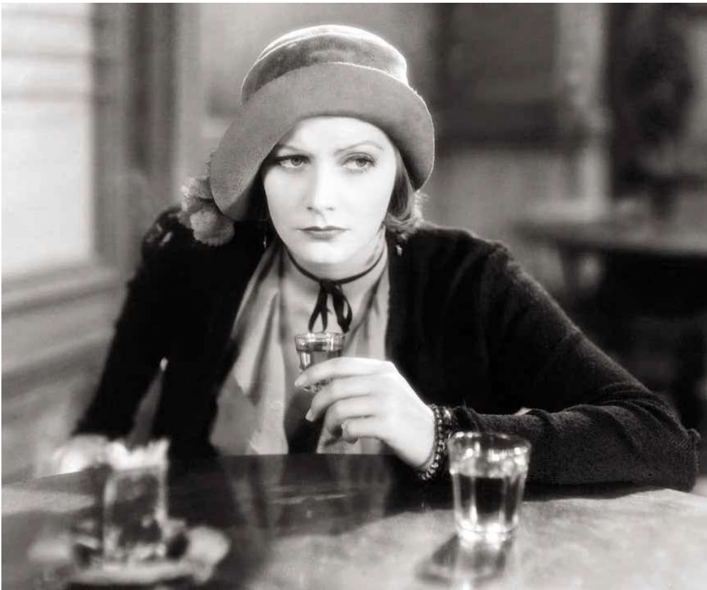
1. Greta Garbo, 1930 körül