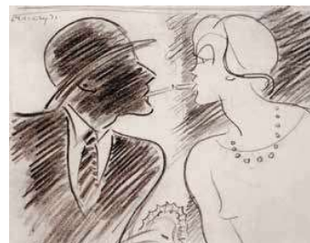
11. Cigaretttázó nő és férfi, 1925, MNG