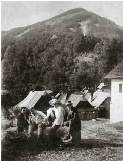
1. Patkó Károly és Aba-Novák Vilmos társaikkal Felsőbányán, 1925

Kezdő ár | Starting price: 20 000 000 Ft / 52 632 EUR Becsérték: 30 000 000 – 40 000 000 Ft Estimate: 78 947 – 105 263 EUR