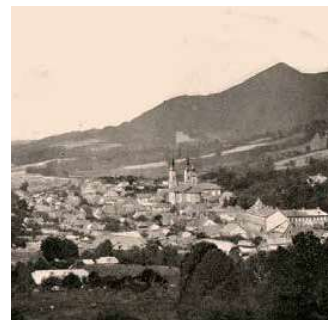
3. Felsőbánya, 1910-es évek archív foto