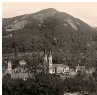
2. Felsőbánya, 1910-es évek archív foto