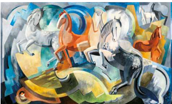
3. Mainie Jellett: Lovak, 1941 National Gallery of Ireland, Dublin