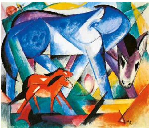
1. Franz Marc: Az első állatok, 1913 magántulajdon