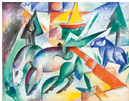
4. Heinrich Campendonk: Lovak a tónál, 1915 Albertina, Bécs

A berlini Der Sturm galéria, az azonos nevű folyóirat és kiadványait igazgatója mind egyetlen ember, Herwarth Walden nevéhez fűződik. Walden ekkor már közel egy évtizede harcolt fáradhatatlanul a modern művészet publicitására – ő maga volt a legfőbb fórum, aki egy személyben döntött arról, hogy ki állíthat ki a Sturmiban, ki írhat a folyóiratba, kinek segíti munkái sokszorosítását, és azok megjelenítését. Kezdetben elsődlegesen az expresszionizmus talaján állt. De ahogy új irányzatok születtek, felkarolta őket, és Kelet- és