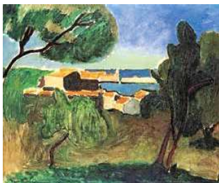
1. Henri Matisse: Colloure-i táj III., 1907 magángyűjtemény