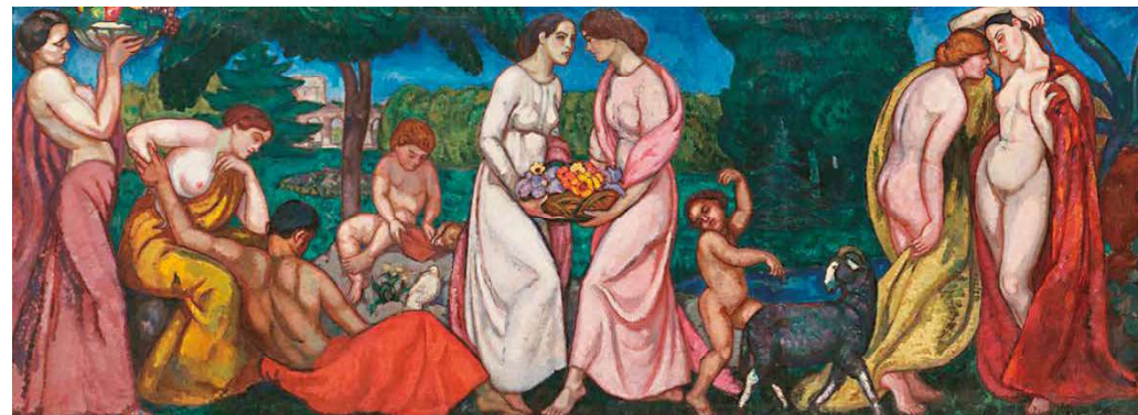
5. Iványi Grünwald Béla: Nyár (Schiffer-villa pannója), 1911 Magyar Nemzeti Galéria

Iványi életművének különösen ragyogó időszaka kezdődött 1912-ben, amikor első kecskeméti műveit megalkotta. Ezek közé tartozik az a műcsoport is, melyek az úgynevezett Műkert színpompás részleteit örökítették meg. A kecskeméti művészet talán legalaposabb ismerője, Sümegi György így írt a helyszín sajátosságairól: „Iványi – a rajzi gyakorlatok mellett – a szabadban való táj- és modellfestést, a valőrök és lokálszínre tudatos elkülönítését, a fénnnyel, színnel való modellálást helyezte korrekktúrja homlokterébe. Mindehhez elegendő volt a Műkert árnyas, rendezett virág-gruppos, fás környezete, az állandó modell, a műtermi és szabadbani munka rendszerének váltogatása. Nem kellett fölkerekedni a tanítványokkal festői helyet keresendő a környéken, mert hiszen nemigen