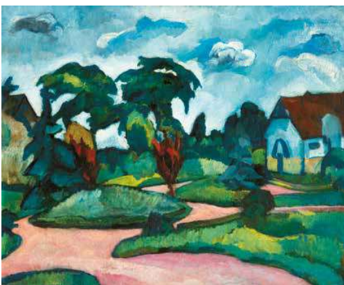
3. Perlrott-Csaba Vilmos: Kecskeméti parkrészlet, 1910-es évek vége magángyűjtemény