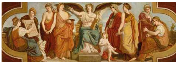
3. Lotz Károly: A Költészet és a Művészet allegóriája (A Magyar Nemzeti Múzeum falképének vázlat), 1874 Magyar Nemzeti Galéria