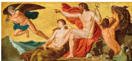
2. Lotz Károly: Diadalmas Neptun, 1872 magántulajdon