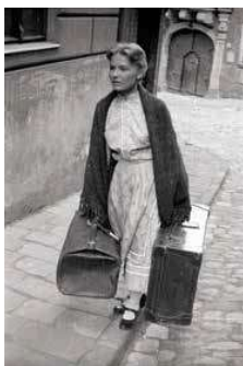
2. Töröcsik Mari az Édes Anna című filmben