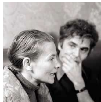
3. Töröcsik Mari és Maár Gyula, 1976

Mednyánszky monumentális őszi tájképe a híres színész-rendező házaspár nappaliját díszítette.