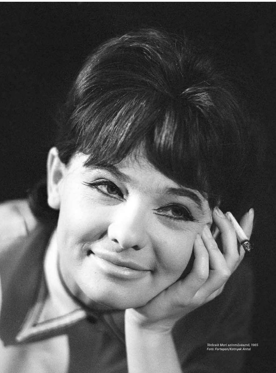
Törőcsik Mari színművésznő, 1965