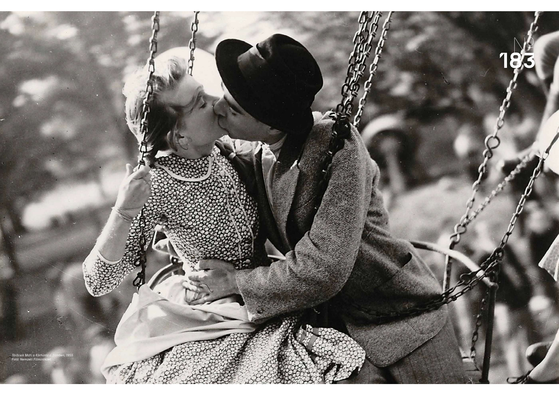
Törőcsik Mari a Körhintá c. filmben, 1955