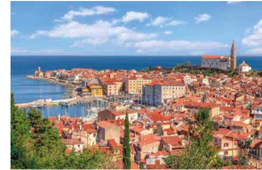
6. Pirano látképe napjainkban