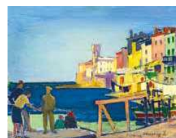
4. Piranói kikötő halászhajókkal, 1927