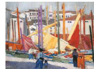
8. Piranói kikötő, 1927