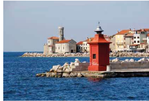
5. Pirano látképe napjainkban

VASZARY OLASZORSZÁGBAN 1926 ÉS 1939 KÖZÖTT