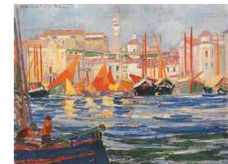
9. Kikötő, Piranó, 1927