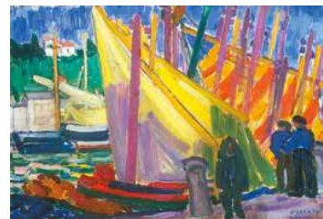
7. Halászbárkák Piránóban, 1927