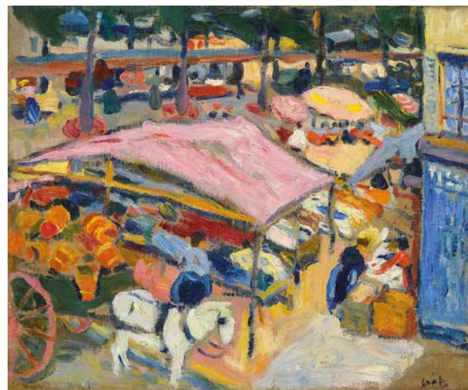
6. Czöbel Béla: A piac sarka, 1905

Az utóbbi másfél évtizedben előkerült belgiumi Czöbel művek kapcsán vetődött fel annak lehe- tősége, hogy a már eddig is jól ismert, Téren (Piactér sarkán) című festmény megfestésének sem Párizs lehetett a helyszíne – ahogy korábban hittük –, hanem Ostende, vagy a zeebruggei tengerpart, esetleg Heist. Erre utal többek között a festményen megjelenő, jellegzetes flamand népviselet, a csipkés fejkötők, valamint a kép középpontjában homokozó kislány motívuma is. Ezek a művei egyértelműen elárulják, hogy Czöbel ekkor, azaz 1905-ben még nem távolodott messzire nagybányai gyökereitől, de a Párizsban látottak hatására már igyekezett eligazodni a számára új irányzatok útvesztőjében. Éppen itt, Bruges-ben születtek meg azok az első, már a posztimpressionizmuson túlkacsintó művei, melyek a következő év nyarán a nagybányai fiata- lok körében valóságos palatoforradalmat robbantottak ki.