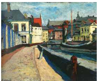
2. Czöbel Béla: Városrészlet, Brugge, 1905 Szentendre Ferenczy Múzeum