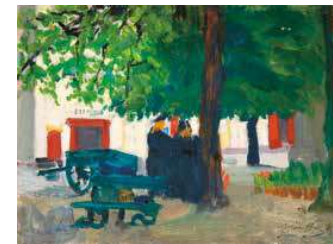
9. Márffy Ödön: Bruges-i részlet, 1905-1906