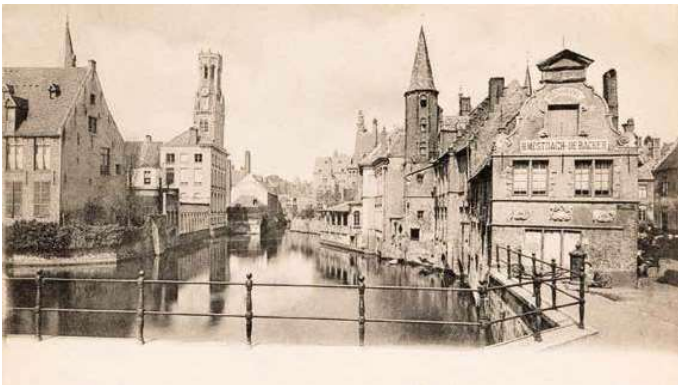
1. Brugge, 1900 körül