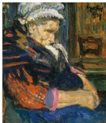
4. Czöbel Béla: Brugge-i öregasszony, 1905