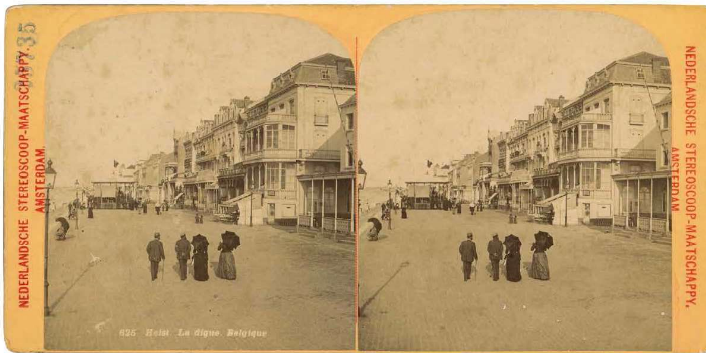
7. Heist, 1900 körül