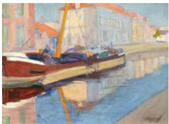
8. Márffy Ödön: Bruges-i csónakok (Hajó), 1906 körül

Az utóbbi évtizedek kutatásai során került elő a most aukcióra bocsátott tájkép is, amelyet Czöbel Zeebrugge egykori halászkikötőjében festett, és a jelzetben is megőrkítette a helyszínt, gyarapítva tudásunkat e korábban teljeségében feldolgozatlan belgiumi intermezzóról.