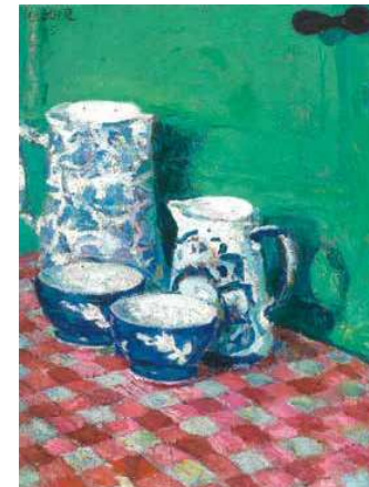
5. Czöbel Béla: Csendélet zöld ajtó előtt, 1905 magántulajdon