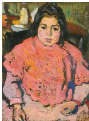
3. Czöbel Béla: Rózsaszín ruhás kislány, 1905 körül