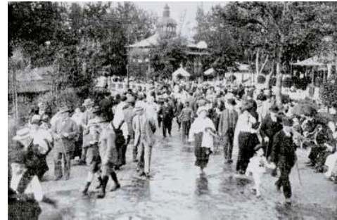
3. Városligeti korzók, 1914 körül