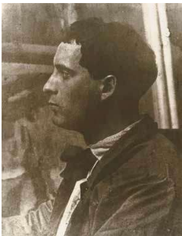
1. Czóbel Béla diákkori képe magántulajdon

Kezdő ár | Starting price: 12 000 000 Ft / 31 579 EUR Becsérték: 20 000 000 – 30 000 000 Ft Estimate: 52 632 – 78 947 EUR