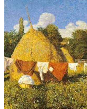
4. Iványi Grünwald Béla: Ruhaszárítás, 1903 magántulajdon