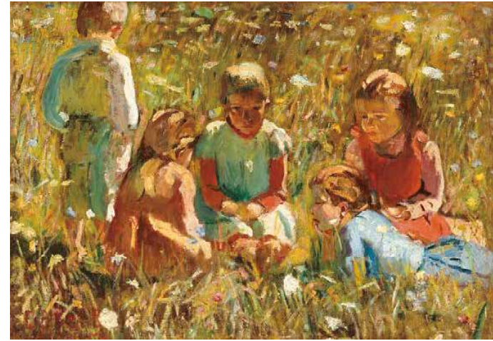
2. Czöbel Béla: Gyerekek a réten (Nagybánya), 1904 magántulajdon

A most aukcióra kerülő festmény 1902 nyara után keletkezett, amikor Czöbel először látogatott Nagybányára. A festő tehát még nem volt húszéves, amikor ezt a képét megfestette. A Hollósy Simon távozása (1902) után átalakult nagybányai festőiskola vezetői (vagyis a „Négyek”) közül Czöbelre is nagy hatással volt Ferenczy Károly művésze, mégis Iványi-Grünwald Bélát választotta mesteréül. A nagybányai mesterek tanítása, a szabad szemlélet és szellemiség, a műtermi fényhatások kerülése stb. akkor is meghatározó maradt Czöbel számára, amikor már a maga útját járta. 1 Czöbelt a nagybányai iskola légköre is elbűvölte. Tersánszky Józsi Jenő így emlékezett a különös fiatalemberre: „Czöbel Béla, az egy pesti gyerek szintén ... Így tartják itten, tehetséges festő. Amikor először járt Bányán,