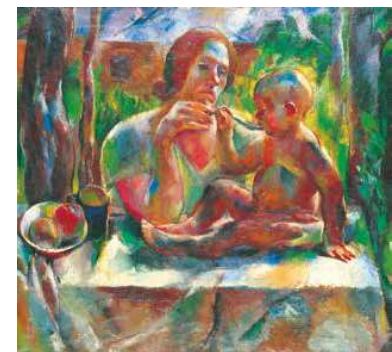
5. Aba-Novák Vilmos: Uzsonna a nyári kertben, 1926