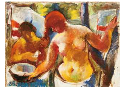
4. Aba-Novák Vilmos: Fésűködők, 1925