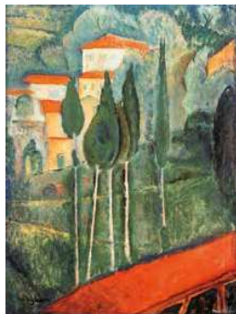
2. Amadeo Modigliani: Dél-Francia táj, 1919 magántulajdon