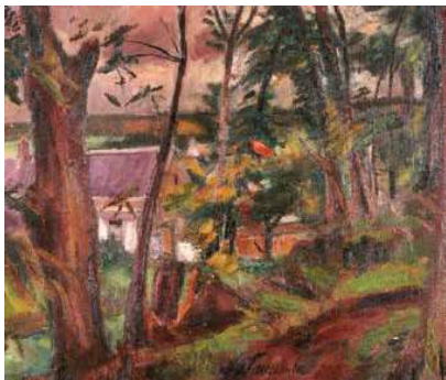
1. Henri Le Fauconnier: Liget Gros Rouvre mellett, 1946 magántulajdon

Kezdő ár | Starting price: 3 400 000 Ft / 8 947 EUR Becsérték: 5 000 000 – 8 000 000 Ft Estimate: 13 158 – 21 053 EUR