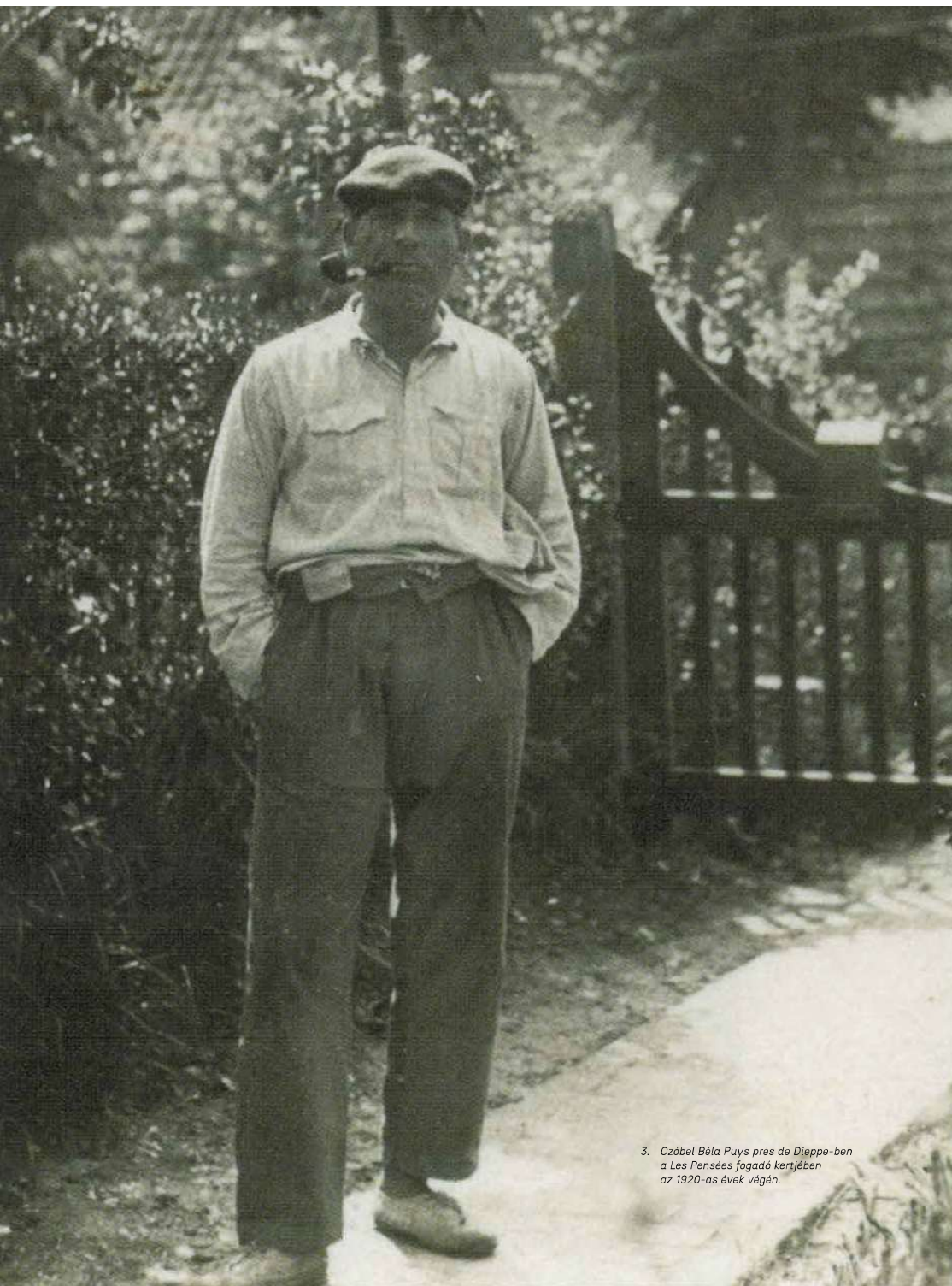
3. Czöbel Béla Puys près de Dieppe-ben a Les Pensées fogaadó kertjében az 1920-as évek végén.