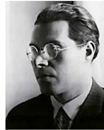
5. Kállai Ernő