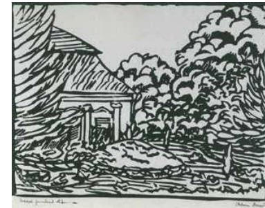
3. Orbán Dezső: A körtvélyesi kúria a kerttel , 1912 körül