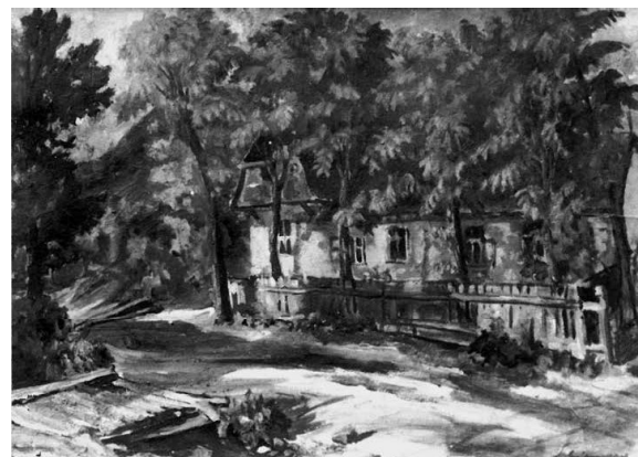
3. Gyimesi Kovács Gábor: A Kádár család Fűrész utcai háza