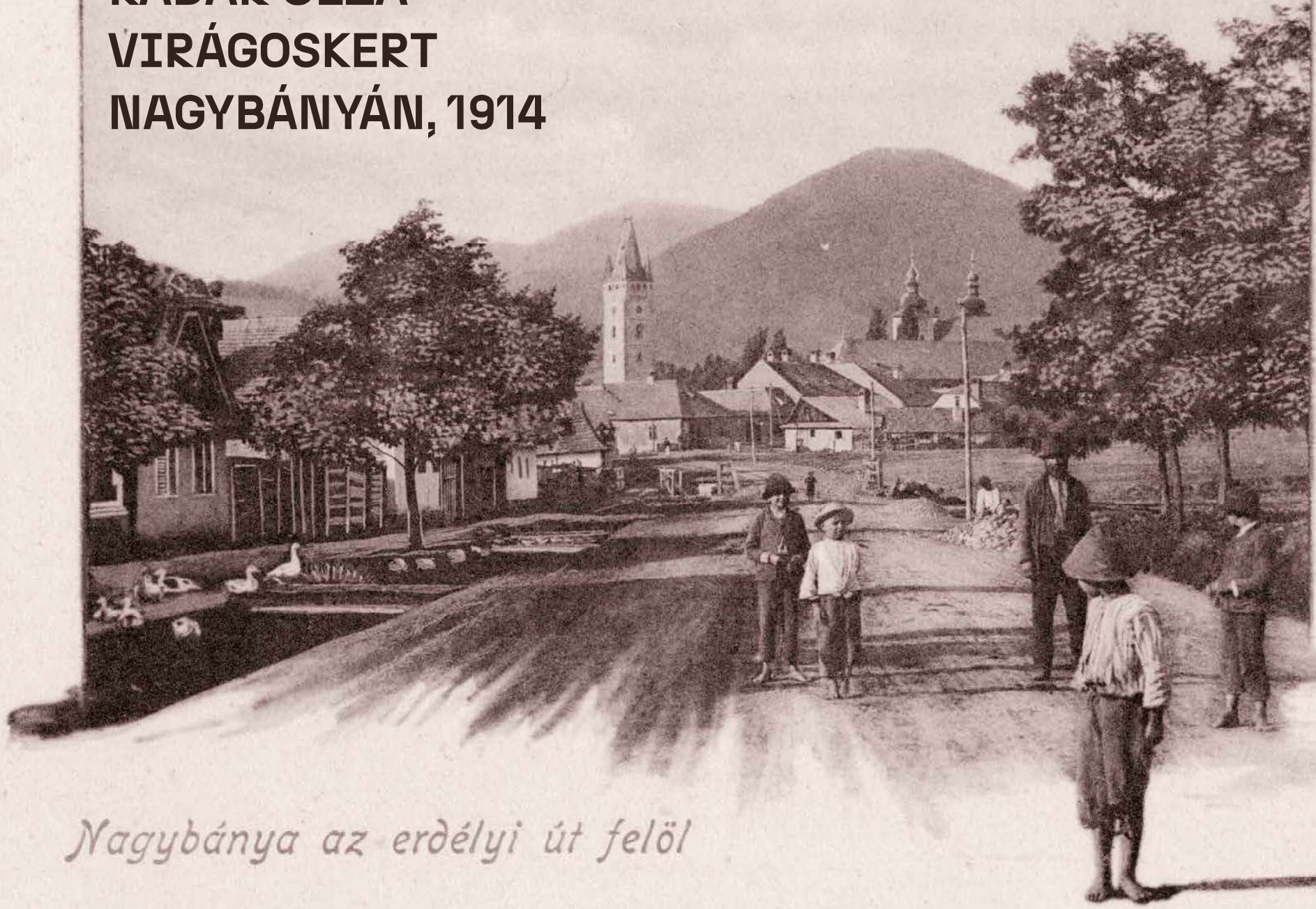
Nagybánya az erdélyi út felől