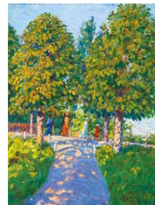
4. Kádár Géza: Nagybányai parkban