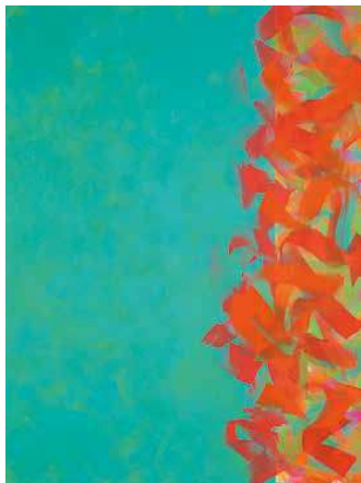
2. Nádler István: Balaton , 2007 magántulajdon

Kezdő ár | Starting price: 4 000 000 Ft / 10 526 EUR Becsérték: 6 000 000 – 8 000 000 Ft Estimate: 15 789 – 21 053 EUR