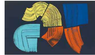
4. Hans Hartung: T-1971-R27, 1971 Nahmad Contemporary, Perrotin and Hartung-Bergman Foundation, New York

A kétezres évek közepétől a színek ismét fontos szerepet kaptak eszköztárában. Nádler „szubjektív eszközkészletére” 1 számos irányzat hatott: a pop-art ellentétes szinkombinációi, op-artos elemek, vagy az absztrakt expresszionizmus gesztusai. Ezeket az elemeket Nádler nem közvetlenül, hanem saját forma-rendszerén átszűrve alkalmazta. A gesztus és a geometria kapcsolatával gyakran kísérletező művész ekkori festményein a gesztus válik meghatározóvá. A hard edge-hez visszanyúló „egzaktan határolt színes felület személytelen »tárgyszerűsége« 2 , és az »izolált tárgy megmásíthatatlan, értelmezhetetlen, provokatív »tényszerűsége« 3 meditatív terekkel és felületi gesztusokkal egészült ki.