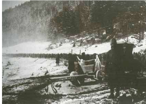
1916. szeptember 30. szombat