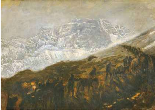
2. Mednyánszky László: Vonuló katonák, 1915-1918 magántulajdon