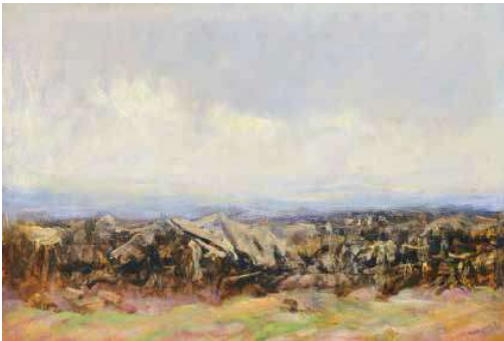
3. Mednyánszky László: Trén

Egy vereskeresztes ápolóné elbeszélése szerint, akinek fogoly olasz sebesültek elmondták, ez következőképpen történt: László sokszor ki szokott mászni a lövészárkokból, háttal az elenségnek, a mi fedezékeinket a sziklakkal mögöttük festve. Az olasz katonák látták nap nap