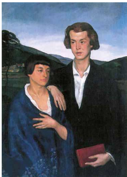
3. Szőnyi István: Kettős arckép, 1917 magántulajdon.