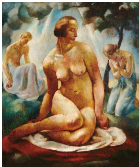
2. Korb Erzsébet: Áhítat, 1923 Magyar Nemzeti Galéria, Budapest