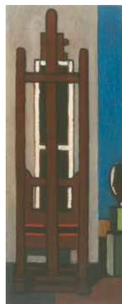
5. Barcsay Jenő: Vörös állvány, 1961