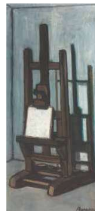
7. Barcsay Jenő: Festőállvány, 1961