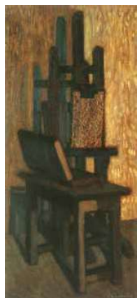
3. Barcsay Jenő: Festőállvány (Csendélet / Állvány festőasztallal), 1957

festményei közül is kiemelkedik a Festőállvány ablak előtt című alkotása. Korábbi képeitől eltérően az állványt itt teljesen frontálisan ábrázolta, az okkertől a halványzöldön át a rózsaszínig ívelő színskála azonban térrel telíti a geometrikus vonalhálót. A festőállvány és az ablak mondriani mélységeket sejtető geometrikus struktúrája éppen a finom, pasztelles színeknek köszönhetően őrzi meg a valóság illúzióját. A puszta eszközt festői szimbólummá nemesítő képen egyedülálló szintézist kapjuk annak, ami a festészetet festészetté teszi: a színnek és a vonalnak, az absztrakciónak és a természetűségnek.