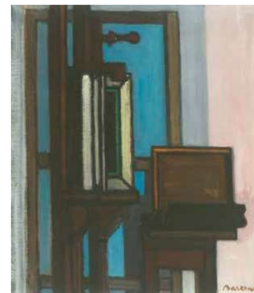
8. Barcsay Jenő: Festőállvány, 1960