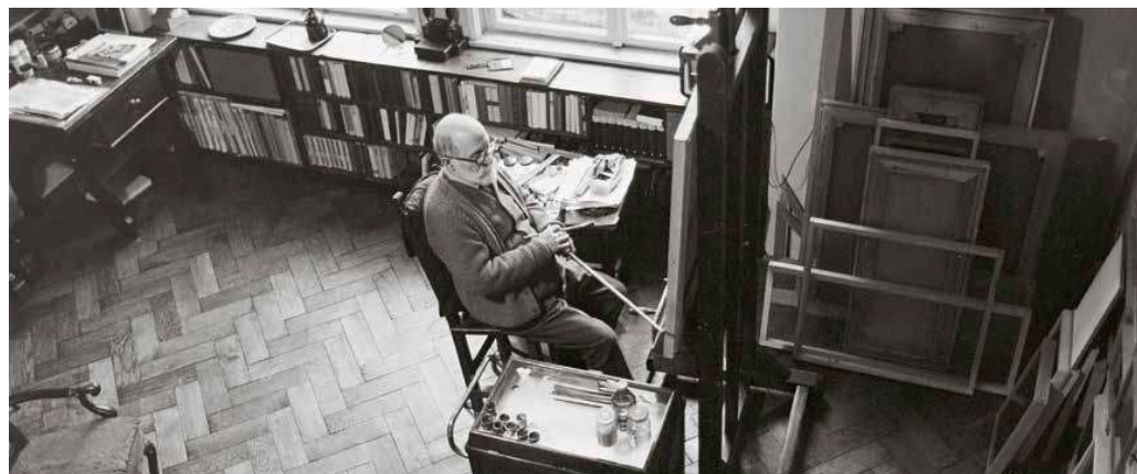
4. Benczúr utca 2., Barcsay Jenő festőművész a műtermében.

Az absztrakt művészet nem utánoz, hanem felfedez: keresi a jelenségek kapcsolatait, összetartozását, s így épít fel egy új egészet. Mélyről jövő, új eredményekben gazdag festői világ ez.” (idézi: Pap, 1974, 24.)