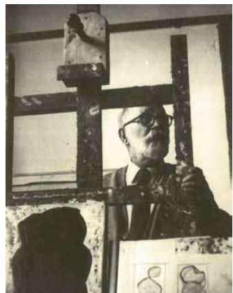
2. Barcsay Jenő festőállvánnyal, Szentendré, 1980