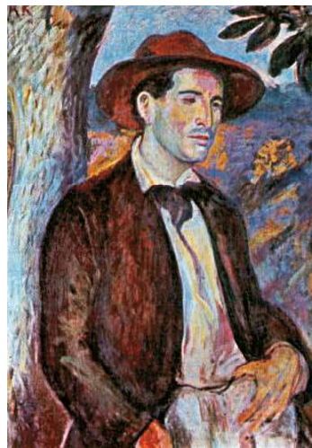
10. Kernstok Károly: Czobel Béla portréja Magyar Nemzeti Galéria