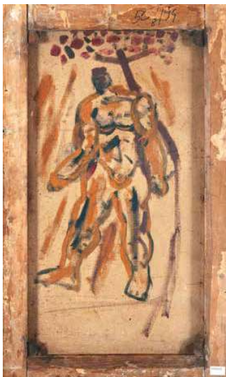
2. Képünk hátoldala