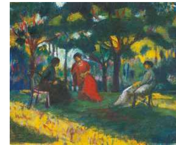
6. Kernstok Károly: Parkban ülők (Délutáni pihenő), 1909 körül