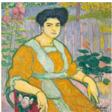
7. Ziffer Sándor: Karosszéknél ülő nő, 1908 magántulajdon

mély bíborok és lilák mellett fel-felvillanó hasány kadmium-sárgák és a különböző kékek egyedi egyvelegét zöldek és barnák sokféle árnyalata öleli körbe. 2 A rendkívül gyors ecsetjárás jól kiolvasható kanyarulatai és cikázásai szinte lépésről-lépésre nyomon követhetően tudósítanak arról, hogy mennyire sebtiben, a látvány azonnali rögzítését szem előtt tartó hevületben készült a kép. Ezt a feltűnően rapid festésmódot valószínűleg Márfytól lehetett el a társaság doyen-je, hiszen több más 1908 nyarán Kernstoknál festett képe közül, például a Nyergesi lány című kartonján is közeli megoldásokkal találkozhatunk, míg Kernstok korábbi képein hasonló festői gesztusok és effektek nem igen tapasztalhatók. A festmény hátoldalán egy még sokkalta se-