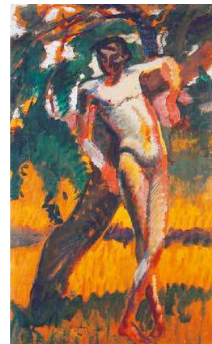
11. Kernstok Károly: Fának támaszkodó fiúkat Magyar Nemzeti Galéria

matikusabb férfiakat sommásan felvázolt alakja látható. Nehéz eldönteni, hogy vajon ezt is maga Kernstok pingálta a vászon hátoldalára – esetleg csak tréfából, hogy az ecsetben maradt festék se menjen teljesen pocsékba – vagy talán a körülötte sertepertelő, állandó modelltől is szolgáló Nyergesi testvérek, János vagy István törölte ki emígy az ecsetet, miután végzett a képpel. A férfialak lábának megformálása igen hasonló egy korban azonos Kernstok festményen látható megoldással (Álló nő akt, 1908, Mgt.), így valószínűbbnek tűnik, hogy a hátoldal férfiját is maga Kernstok festette. 3 Korszakhatározó a festmény szignatúrája is, ugyanis Kernstok ekkoriban készült festményein sűrűn alkalmazta a bekarcolt aláírást, de az azt felül-