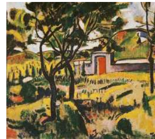
5. Czöbel Béla: Nyergesújfalusi udvar, 1907

Kernstok azonban kapott hideget is a kritikusoktól, ugyanis a konzervatívabb szemléletű zsurnaliszták értetlenül álltak a művész ultramodern páfordulása előtt. Elítélték az általuk amúgy elismert mestert, amiért háttal fordított korábbi önmagának néhány ifjú forradalmár-titán vezérékét. Kernstok ekkoriban valóban meglepően újszerű alkotásokkal rukkolt elő, amelyekkel valósággal sokkolta a korabeli közönséget.