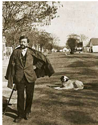
4. Kernstok Károly Nyergesújfalun

Kernstok Károly a huszadik század első éveiben már befutott, elismert művésznek számított Magyarországon, így amikor 1907-ben megszerveződött a M.I.É.N.K., a Magyar Impressionisták és Naturalisták Köre, olyan idősebb, nagy tiszteletben álló mesterekkel léphetett egyenrangú félként az alapítók sorába, mint Ferenczy Károly, Szinyei Merse Pál vagy Rippl-Rónai József. Ekkoriban gyakran megfordult Párizsban is, ahol közvetlen testközelből figyelhette a legmodernebb stílustendenciák alakulását, sőt magukkal a stílusformáló mesterekkel is találkozhatott, mint például Henri Matisse-szal vagy Pablo Picassóval Gertrude és Leo Stein híres szombat esti összejövetelein a Montparnasse-on. Ezekre a zártkörű művészeti szalonokra barátja, Czöbel Béla közbenjárásával nyert beavatást, akit 1907 nyarán meghívott nyergesújfalusi birtokára, hogy együtt fessenek, gondolkodjanak, beszélgessenek a művés-