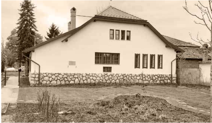
3. A Kernstok villa Nyergesújfalun