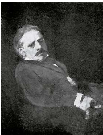
1. Munkácsy Mihály: De Marche báró arcképe, 1872 magántulajdon