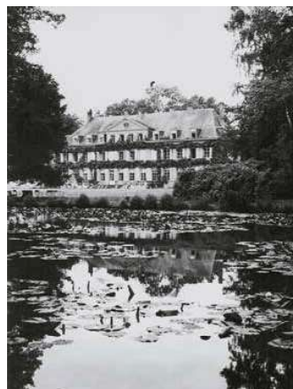
3. Colpach az 1880-as években

Colpach grófsága a XVII. században került házasság révén a Gascogne-ból származó De Marche család tulajdonába. Henri Edouard de Marche báró (1820–1873) 1863-ban örökölte meg a belga-luxemburgi határhoz közeli colpachi kastélyt és a hozzá tartozó birtokot, éppen két évvel azelőtt, hogy feleségül vette a polgári családból származó Cécile Papiert.