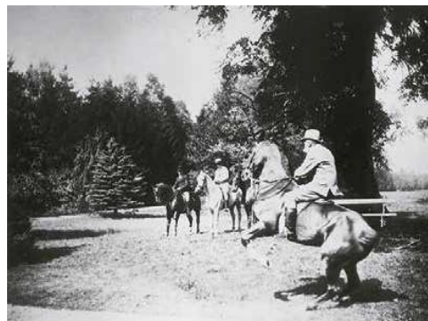
4. Munkácsy láhátan a colpachi parkban

Kezdő ár | Starting price: 4 000 000 Ft / 10 417 EUR Becsérték: 6 000 000 – 10 000 000 Ft Estimate: 15 625 – 26 042 EUR