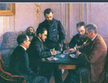
4. Gustave Caillebotte: Egy játszma beziq, 1880 magántulajdon

Lyka ifjúkori nyitri emlékei a pár hónapig ott dolgozó Rajzról, szinte az egyetlen hiteles forrás erről a kivételesen tehetséges, de a csekély számú életmű okán alig ismert művészről.