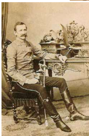
3. Tiszt az Osztrák-Magyar Monarchia hadseregében