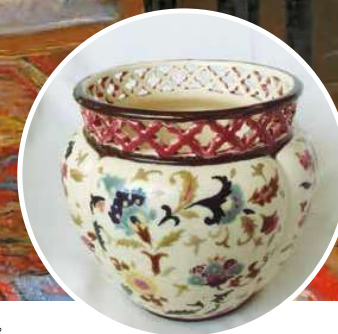
5. Zsolnay perzsa mintás kaspó, 1860-as évek->