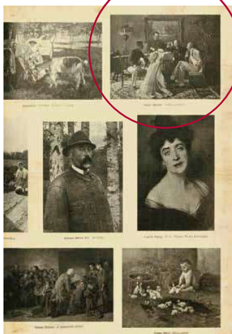
2. A festmény reprodukciója a Vasárnapi Ujságban, 1897