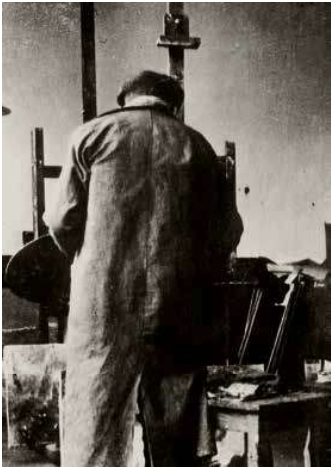
3. Mednyánszky László festés közben

Bár elmondása szerint sosem szerette, Mednyánszky László három alkalommal töltött hosszabb-rövidebb időt a francia fővárosban, 1874-től az École Nationale des Beaux-Arts növendéke volt, ekkor ismerkedett meg az akkoriban szintén Párizsban élő Paál Lászlóval, Zichy Mihállyal és Munkácsy Mihállyal, majd a „fontainebleau-i erdő alá, a világhírű kis faluba, a tájképfestészet újáteremtőinek, a Rousseauk, Corotk, Milletk, Daubignyak tanújára, Barbizonba” 1 utazott.