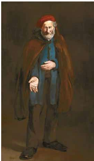
1. Édouard Manet: Koldus kabáttal (Filozófus), 1865–1867 közt Art Institute Chicago, Chicago

Mednyánszky László naplója, 1916. december 24. (I.)