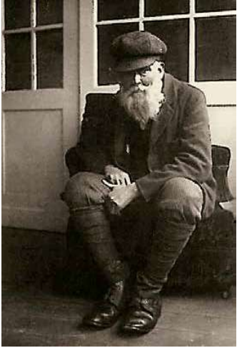
2. Mednyánszky László