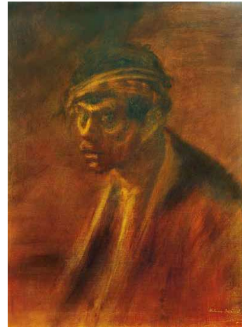
5. Mednyánszky László: Csirkefogó, 1897 körül