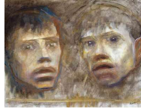
4. Mednyánszky László: Két fej, 1900 körül

A párizsi csavargók, koldusok alakjai a festészettel párhuzamosan az irodalomban is megjelentek. Mednyánszky számára így mind a képi, mind az irodalmi tradíció adva volt, példaként említve Eugène Sue Párizs rejtelmait, Victor Hugo Nyomorultjait, melyek az első mintákat jelenthették a „romantikus alászállásra”. 9 Szerette vagy sem, de a párizsi alvilág, a Sue és Merger utcáin szerzett élmények, tapasztalatok hatására Mednyánszky nemcsak a magyar, de az európai festészetben is egyedülállót alkotott. A most aukcióra kerülő Csavargó egy kiemelkedő festmény ebből a korszakból.