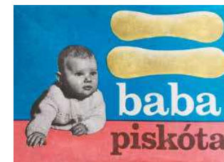
6. Retro csomagolások, Magyar Edesipar