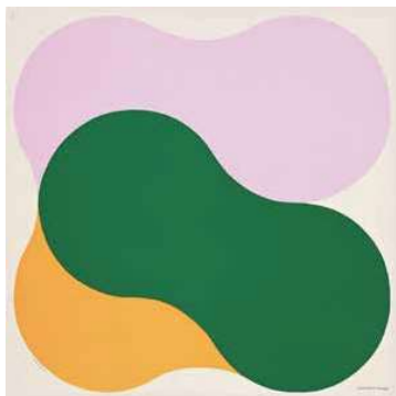
2. Richard Gorman: Squeeze , 2016 (sálterv a Hermès Paris-nak)