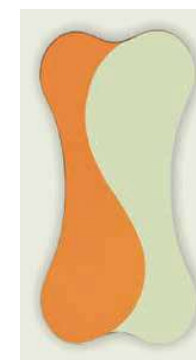
5. Leon Polk Smith: Sun, 1958-1959