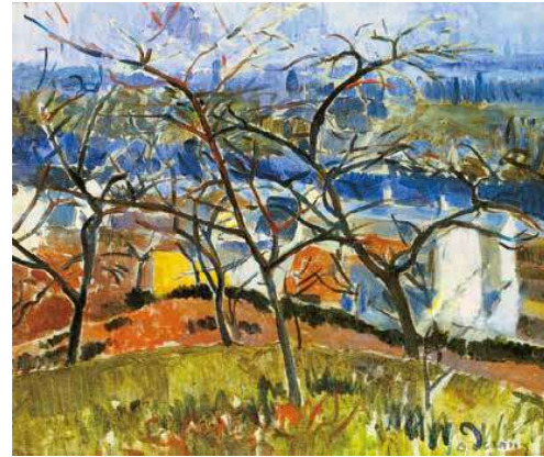
4. André Derain: Chatou melletti táj, 1904 magántulajdon

A vezető mesterek közül pedig Iványi volt a legnyitottabb ezekre az újdonságokra. Az 1900 és 1910 közötti évtized a magyar modernizmus igazi aranykora volt. 1907 tavaszán jelentős