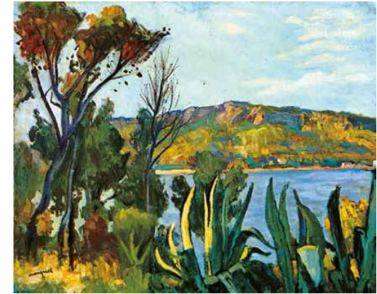
5. Albert Marquet: Agay látképe, 1905 magántulajdon

művészeti eseményre került sor a budapesti Nemzeti Szalonban, amikor Paul Gauguin 67 művéből rendeztek retrospektív kiállítást. Iványi a párizsi fejleményekről addig csupán volt tanítványaitól értesülhetett. A legmodernebb irányokba történő fordulásához a döntő impulzus ekkor, 1907 májusában érte, amikor a Gauguin-tárlaton először szembesült a francia posztimpreszionista mester műveivel. A kiállítás nemcsak Iványit, de még a nála jóval konzervatívabb, szintén nagybányai alapító Thorma Jánost is addigi művészeti alapállásának korrekciójára kényszerítette. Iványi 1907 októberében csatlakozott a Műcsarnokból, azaz a hivatalos művészeti szcéből kivonult művészek által alakított Magyar Impreszionisták és Naturalisták Köréhez. Az első közös bemutatóra 1908 januárjában került sor, mely még a konzervatív kritikuskak többségének elismerését is kivívta. „...meglepő, hogy egy oly megállapodott egyéniségű művész,