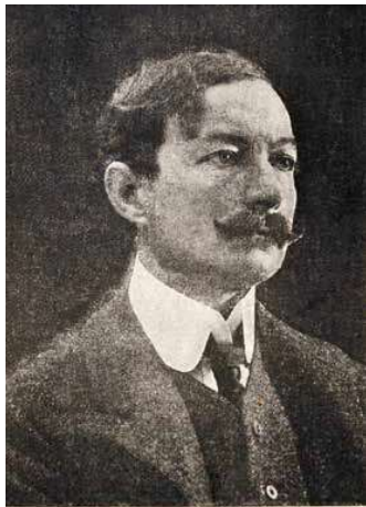
Iványi Grünwald Béla festőművész.