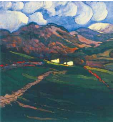
3. Iványi Grünwald Béla: Nagybányai táj a Gutinál, 1905–1906 Janus Pannonius Múzeum, Pécs

K evés olyan mester található a magyar és az egyetemes művészet körében, aki a biztos megélhetést, a már bejáratott és a nagyközönség által elfogadott és megszeretett stílust feladva, a mindig újtásra kész fiatalabb nemzedék élére állt. Nálunk ilyen volt Kernstok Károly, aki a Nyolcak vezető mestereként tört utat a hazai modernizmusnak, és Iványi Grünwald Béla, aki a kecskeméti művésztelep megalapításával és vezetésével tette ugyanezt. Magyarországon szinte egyidőben jelentkezve, az 1900-as évtized vége felé érték el a kritikus szintet azok a művészeti törekvések, melyek a francia és a német modernizmus határvonalán egyensúlyozva, sajátosan hazai, de mégis modern ízt akartak meghonosítani a képzőművészetek terén itthon, és felmutatni ezt a határainkon túl is. Népművészetünk színpompája, gazdagsága és rendkívüli eredetisége olyan municiót kínált a magyar festőknek és grafikusoknak, mely ilyen erőteljes