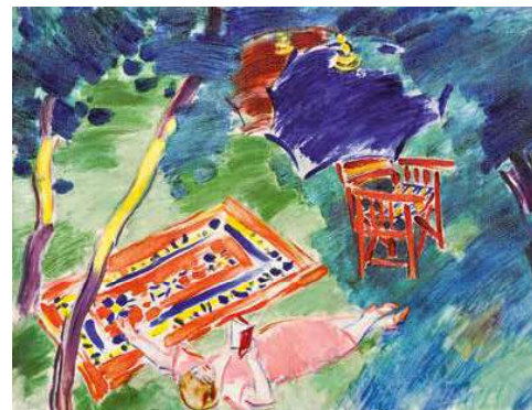
9. Vaszary János: Pihenő a kertben, 1935 körül magántulajdon