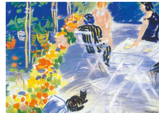
10. Vaszary János: Pihenők a kertben, 1935 körül magántulajdon

Vaszary változatos parkjeleneteinek, és az Ablakban című képnek is a színhelye a festő tatai házának a kertje. A Vaszary házaspár tavasztól késő őszig a Thoroczkai Wiegand Ede által tervezett házban lakott: a gyönyörű virágágyásokkal szabdaltnak, árnyas parkra néző villát nagy fák, és gyümölcsösök vették körül. A tatai villa a béke és csend szigete volt, mely egyre nagyobb szerepet kapott az idősödő festő életének utolsó bő évtizedében. Művészetének utolsó és leghosszabb korszaka is erre az időszakra esik. A naturalista, realis-