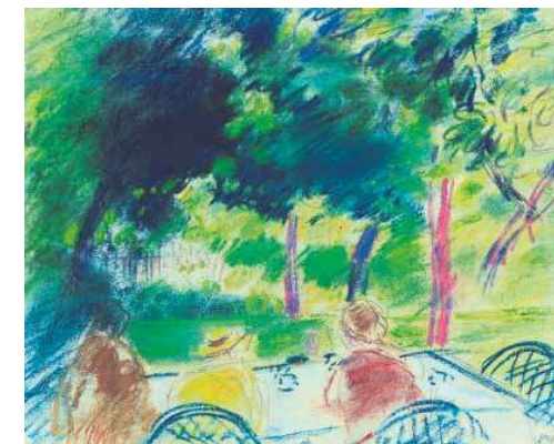
12. Vaszary János: Parkban, 1930 körül magántulajdon