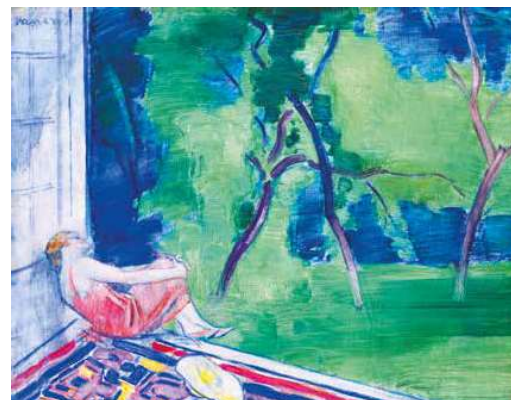
11. Vaszary János: Verandán, 1930-as évek magántulajdon

hölgyet. Vaszary minden bizonnyal a szélesre tárt teraszajtó mögött a szobában állva figyelte és rögzítette a látványt. A fehérre alapozott vászonra prima vista, gyors, széles ecsetvonásokkal dobta fel a festéket, melyet üvegpalettára nyomott ki a tubusból, hogy minél jobban érzékelje a színek intenzitását. Vaszary egyik legnagyobb érdeme az, hogy minden modernsége, a redukció és az absztrakció, azaz az átalakított látvány ellenére meg tudta őrizni par excellence festőiségét, ragyogó dekorativitását.