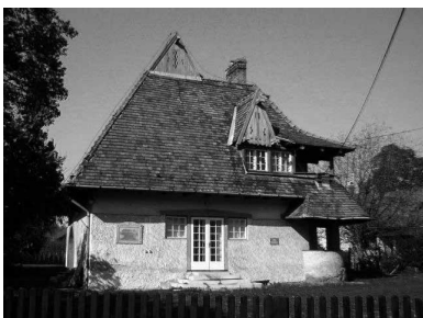
5. A Vaszary villa az 1910-es években