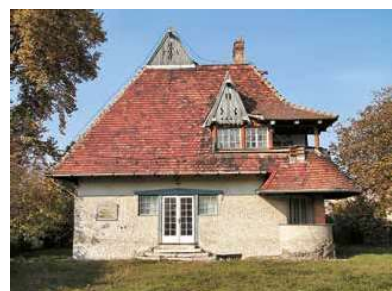
7. A Vaszary villa 2000 körül