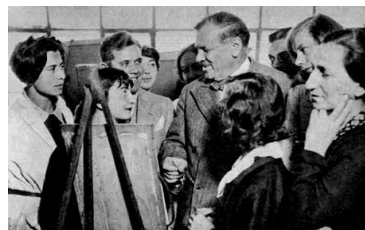
4. Vaszary János tanítványai között