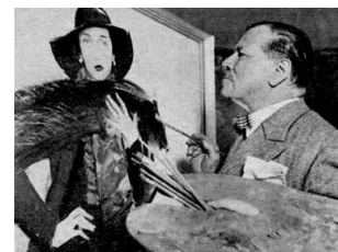
3. Vaszary János fest