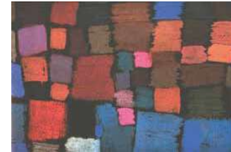
1. Paul Klee: Virágzás, 1934 Beyeler Foundation, Riehen, Svájc