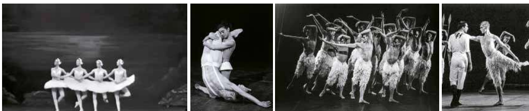
1. A hattyúk tava az orosz állami televízióban, a szovjet puccskíséret napján, amely végül a Szovjetunió bukását hozta, 1991. augusztus 19.