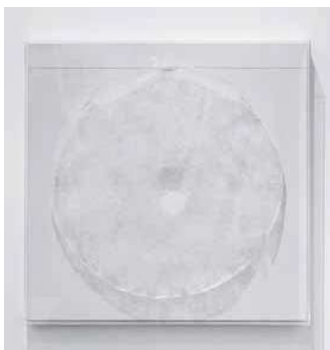
1. Liang Shaoyi: Planar Tunnel, 2011

Pauer Gyula rendkívül sokoldalú művész volt, de az eredettől, vagyis a szobrászi múlttól és látásmódtól sohasem szakadt el igazán. A hatvanas évek elején elsajátított mesterségbeli fogások, mint a gipsz-használat és az „álcázási” technikák, először az 1963 és 1966 között készült szobrokon jelentek meg. Az évtized végére pedig a formai és optikai hatásokkal való kísérletezések következményeként eljutott a plasztika valós formáinak álcázásához, oly módon, hogy a térbeli, minimalista alapforma felületére egy másik forma képét rögzítette. Pauer rátalált a „pszeudo” kifejezésre (jelentése: „ól, hamis, nem valódi, valódinak látszó”), amelynek középpontba helyezésével 1970-re egész művészi programmá nőtte ki magát, majd fokozatosan általános érvényűvé vált. Mi