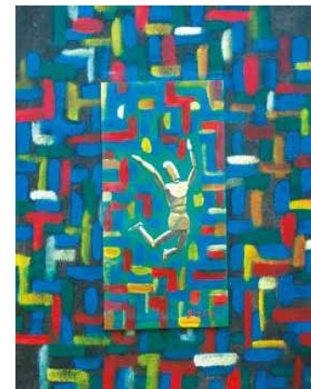
4. Jean René Bazaine: Sans titre magántulajdon