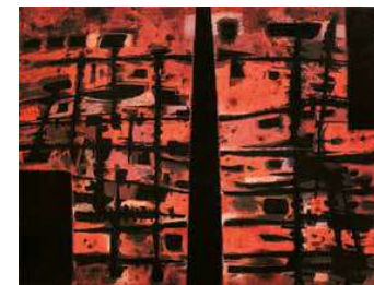
3. Alfred Manessier: La sixième heure ('A hatodik óra'), 1958 Centre Pompidou, Párizs