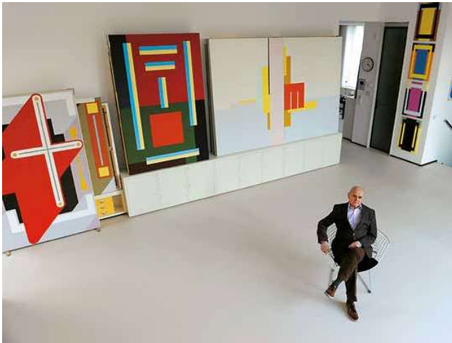
1. Bak Imre műtermében, 2019