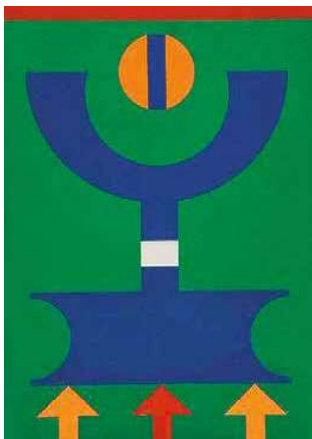
2. Rubem Valentim: Sem título ('Cím nélkül', szériográfia), 1989 Acervo Câmara dos Deputados, Palácio do Congresso Nacional, Brasil

A hetvenes évekre Magyarországon is virágkorát élték a strukturalista, szemiotikai, etnopszemiotikai, antropológiai, nyelvfilozófiai vizsgálódások. Mindez szorosan összefüggött az egységes világtkép széthullásával, atomizálódásával, az analitikus gondolkodás válságával, és az erre reakcióként adott, egységes jelrendszer, új egyetemes nyelv és világszemlélet megtalálásának vagy megalkotásának növekvő igényével. A modern képzőművészek és irányzatok azon része, amelyek hittek még egyfajta totalizált, univerzális rendszer létezésében, az Európán kívüli, a prehisztórikus- vagy a népművészet felé fordultak, annak reményében, hogy ott megtalálják. Bak Imrét már művészi indulásakor a festői formák és színek természete, mindenkori lehetőségei, jelentései érdekelték. Eleinte a magyar népművészet jellegzetes díszítő motívumait kereste,