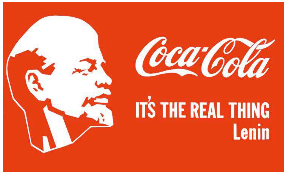
4. Alexander Kosolapov: Lenin-Coca-Cola, 1980 magántulajdon