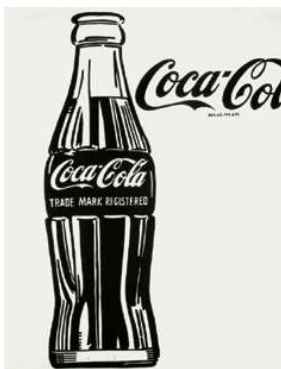
1. Andy Warhol: ‘Large Coca-Cola’, 1962 körül magántulajdon