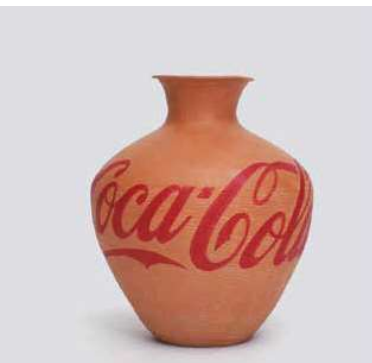
3. Ai Weiwei: Coca-Cola váza, 2015 magántulajdon © Ai Weiwei Studio

Pinczehelyi Sándor művészetéről elmondható, hogy rendkívül sokrétű (mind a médiumok és műfajok, mind az anyagi és technikai repertoár tekintetében), folyamatosan változik, továbbá jól elkülöníthető korszakokra osztható. Mégis már a kezdetek kezdetén kiviláglanak benne azok a jellegzetességek (pl. motívumkereső/szimbólumteremtő attitűd, önreflexivitás, sűrítés, ismétlés, sokszorosítás, sorozatjelleg), amik az életművet egységes és egységessé teszik. Ebben feltétlen jelentékeny szerepet játszik Pécs – illetve a város művészetének és művészetire termékenyítő halású múllja és jelene. Emellett a Budapesttől (vagyis a központtól) való távolság alaphelyzete és