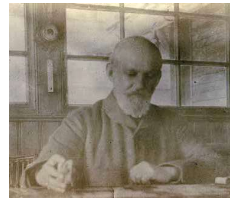
5. Mednyánszky László festés közben, Újtárfüreden, 1910 körül