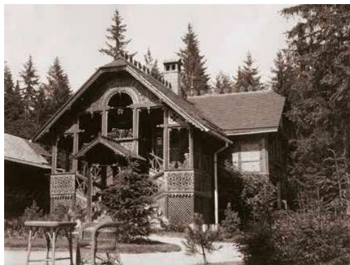
3. A Wolfner-villa, Újtárfüred, 1910 körül