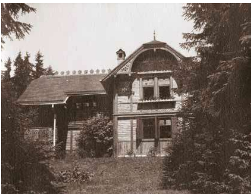
2. Wolfnerék újtráfarei villája