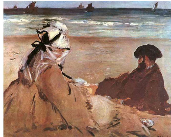
2. Edouard Manet: Tengerparton, 1873

„Réti képjegyzéke még két olaszországi festményről tesz említést. Mindkettő Anzióban készült 1907-ben. Az egyik, a Tengerparti villa, eltűnt, semmilyen nyoma sem maradt. A másik, a Férfiak a tengerparton, a második világháború idején került ismeretlen magántulajdonba. Ez utóbbi tárlaton is szerepelt, a MIÉNK első kiállításán, és maga Réti e korszakának legjobb művei között tartotta számon. Reprodukálását is tervezte »A nagybányai művésztelep« képanyagában” – olvasható Aradi Nórának a művészről szóló, maig társtalán monográfiájában.