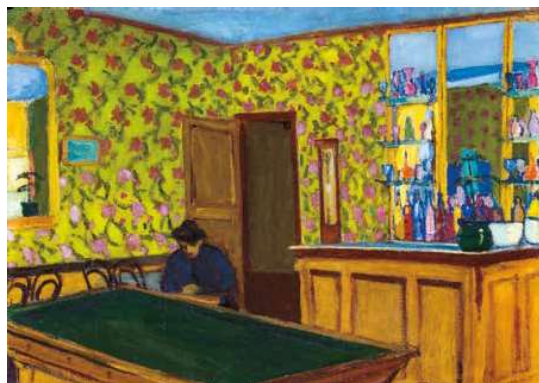
3. Márfyy Ödön: A zöld tapétás szoba, 1906 Magyar Nemzeti Galéria, Budapest

A fiatal Márfyy Ödön a főváros ösztöndíjával jutott ki Párizsba 1902 őszén. A Julian Akadémián eltöltött rövid idő után átiratkozott az állami képzőbe, az École des Beaux-Arts-ba, ahol négy esztendőn át szorgalmasan tanult: a szigorú, akadémikus képzés során tanáraitól elsajátította a klasszikus mesterségbeli fogásokat, a növendéktársaitól pedig az újszerű látásmódot. Emellett rendszeresen látogatta a galériákat, kereste a modern képeket. Nagy hatással volt rá a posztimpressionisták és a nabik festésze, személyesen is megismerkedett Matisse-szal, és tanúja volt a fauvizmus kibontakozásának. A nyári időszakokban nem utazott Nagybányára, mint sok magyar társa, hanem Olaszországba, Bretagne-ba és Bruges-be tett festőutakat. Az így eltöltött négy esztendő a felkészülés időszakának szánta: Magyarországon 1906-ban a Műcsarnok Tavaszai Tárlatán állított ki nyolc képet ebből az időszakból, míg néhány hónappal később Párizsban, az Őszi Szalonon mutatkozott be négy belgiumi enteriőrrel.