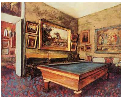
2. Edgar Degas: A biliárd szoba Menil-Hubert-ben, 1892 Staatsgalerie Stuttgart, Stuttgart