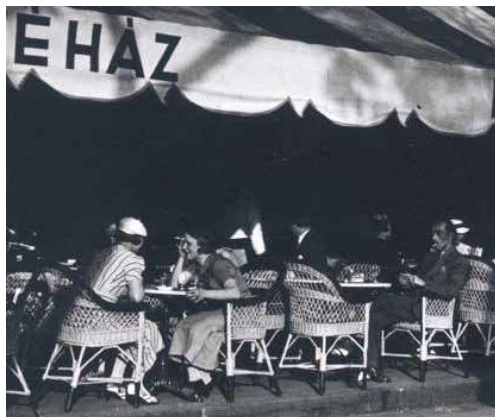
4. A Negresco kávéház Budapesten, a Duna-korzón, 1937

A korábban elsajátított expresszionista, kubista és futurista stílusjegyek, egyéni szintézisbe olvadva jelentek meg Schönberger két háború közötti művészetében.