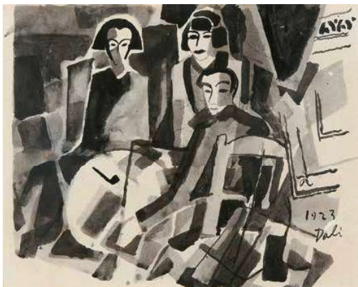
3. Salvador Dalí: Kávéházban, 1923 Magántulajdon