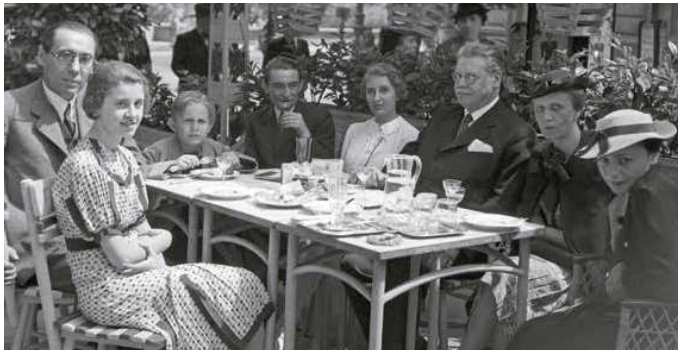
2. Kávéházi terasz Budapesten, a Clark Ádám téren, 1937

Schönberger Armand most aukcióra kerülő remekén is egy ilyen szórakozóhelyre pillanthat be a néző, ahol nők és férfiak beszélgetnek, dohányoznak, és feltehetően alkoholos italokat fogyasztanak egymás meghitt társaságában. Schönberger két háború közötti festészetének egyik legjellegzetesebb témája volt a nyilvános közösségi terekben pezsgő társasági élet. Az 1920-as évek első felétől fordult festői témaként a zenés kávéházak, mulatók és bárók világához. A mindennapi élet szerves részévé vált kávéházi időtöltés, a divatos nagyvárosi létforma és életérzés egyik legszemléletesebb példájaként, kiváló alkatot biztosított a művész számára, hogy naprakészen modern, mozgalmas képi világokat teremtsen. Bár Schönberger az 1910-es évek végén stílusában kapcsolódott a Kassák Lajos körül csoportosuló aktivistákhoz, de politikamentes hozzáállása, mely távol tartotta minden konkrét ideológiai tartalomtól, viszonylag hamar más irányba, új utak keresésére sarkallta.