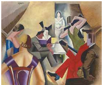
1. André Lhote: Tánc a bárban, 1920–1925 között Magántulajdon

Kezdő ár | Starting price: 8 000 000 Ft / 20 253 EUR Becsérték: 10 000 000 – 15 000 000 Ft Estimate: 25 316 – 37 975 EUR