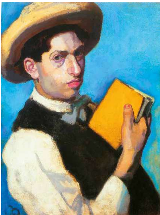
1 Berény Róbert: Szalmakalapos önarckép, 1906 Magyar Nemzeti Galéria, Budapest

Most, hogy végre előkerült a hosszú lappangásból, alapos tisztításon esett át, melynek során előjöttek a várva várt, Berénytől megszokott szinkombinációk, a rá oly jellemző rafinált fakturális megoldások, ám az ecsetjárás szabadabb szertelensége, a körvonalak lezser fellazítása kissé elbizonytalanította a korábbi hipotetikus datálásunkat, és felmerült, hogy esetleg akár egy évtizeddel is későbbi lehet a most árverésre kerülő mű. Legközelebbi analógjának mégis, a Nemzeti Galéria büszkesége, a Szalmakalapos önarckép tűnik, mely 1906 októberében készült. A múzeumi kép reprezentatív fessességéhez, fegyelmelzettségéhez képest azonban a most előkerült önpotré valóban oldottabb, de ez nagy valószínűséggel inkább vázlatosságának, a stúdiumjellegnek tudható be, amit alátámaszt a festmény hordozójának alapanyag-választása is. A festőzubbony zabolátlan hévvel felhordott, elnagyoltságát élesen ellenpontozza az arc magabiztosan sziporkázó szín- és tónus-gazdagsága, bravúrosan biztos kezű, alapos kivitelezése.