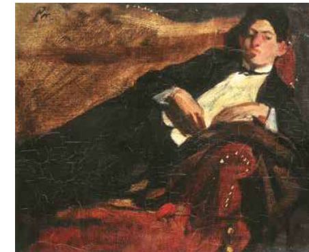
6. Pór Bertalan: Haverő férfi (Berény Róbert), 1907 Magyar Nemzeti Galéria, Budapest

A mű hátlapja egyéb érdekes információkat is rejt. Egy kiállítási etikett felragasztásának nyomai mellett ceruzával írt 700 Koronás ár is olvasható a hátoldalon. A festő 1919-es emigrálásáig tartó korai időszakában zajlott kiállítások katalógusaiban a neve mellett egyetlen festménye kapcsán sem jelent meg 700 koronás ár, bár az is igaz, hogy nem minden kiállítási szereplésével kapcsolatban áll rendelkezésünkre katalógus. Például Bölöni György 1909 tavaszán-nyarán vidéki városokban rendezett vándorkiállítását, ahol Berénytől is gazdag kollekciót vonultatott fel, pontosan a mai napig nem sikerült rekonstruálnunk. Katalógus egyik helyszínről sem maradt ránk, ellenben a turné sajtóvisszhangja jól feldolgozott. Berény önportréjáról ugyan nem esik említés a lapkritikákban, ám ez nem