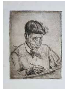
5. Berény Róbert: Önarckép (rézkarc), 1919