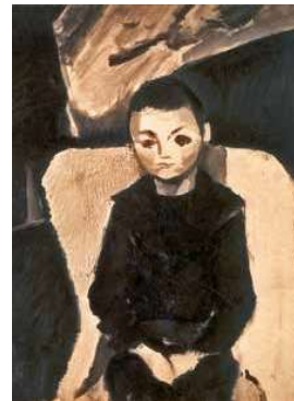
4. Berény Róbert: Fiúportré, 1911 körül