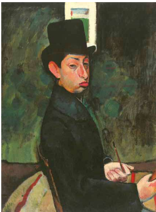
2. Berény Róbert: Cilinderes önarckép, 1907 Janus Pannonius Múzeum, Pécs

gyalt művünk. Az sem zárható ki, hogy esetleg még az Académie Julian-ban vagy más párizsi magánakadémián (Humbert, Grand Chaumiére stb.) készülhetett ez a remek rapid stúdióm. A hátoldalára ceruzával firkált – nem feltétlen tőle származó – fejtanulmányok, karikatúrák is erre utalnak.