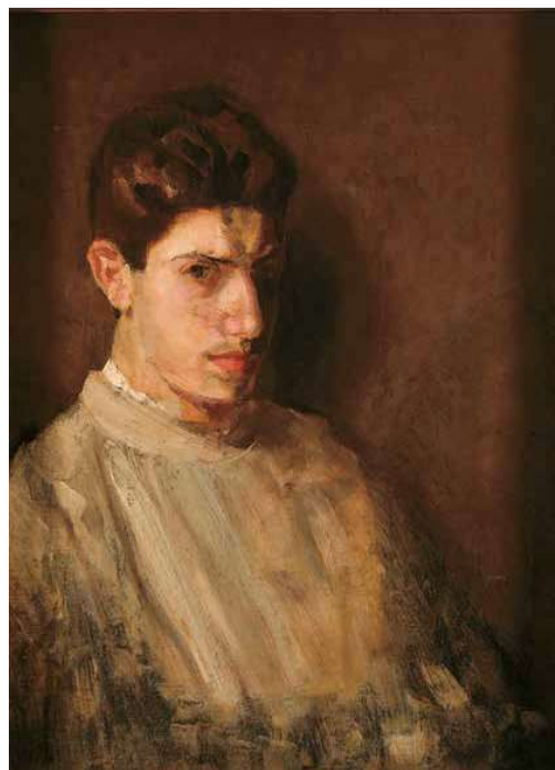
3. Berény Róbert: Önarckép, 1903 Magyar Nemzeti Galéria, Budapest