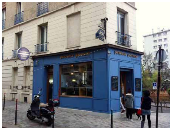
12. A festményen látható helyszín napjainkban

dása során, esetleg pár héttel vagy hónappal később, már pécsi hazatértét követően. A mű Gábor Jenő art deco stílusban festett műveinek egyik legreprezentatívabb darabja, mely bár különleges kvalitású, de nem társtan az életműben. Hasonló darab a szintén ekkoriban született A párizsi Jockey Clubban címen reprodukált és jelenleg lappangó olajképe, valamint a pécsi Janus Pannonius Múzeum gyűjteményében lévő Le Havre-i matróbál című festménye. E három kivételes színvonalú alkotás ékesszólóan tanúsítja Gábor Jenő különleges művészi erejét, nem mindennapi