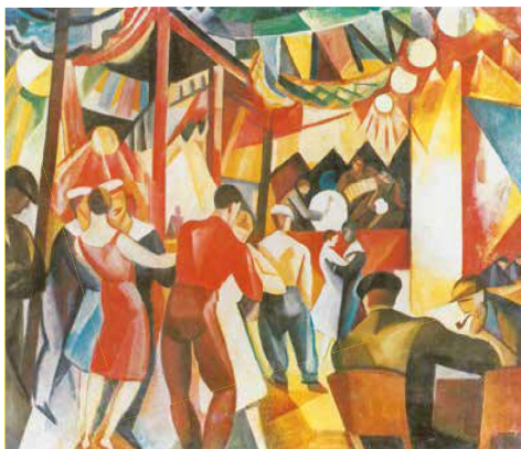
11. Gábor Jenő: Le Havre-i matróbál, 1927 Janus Pannonius Múzeum, Pécs