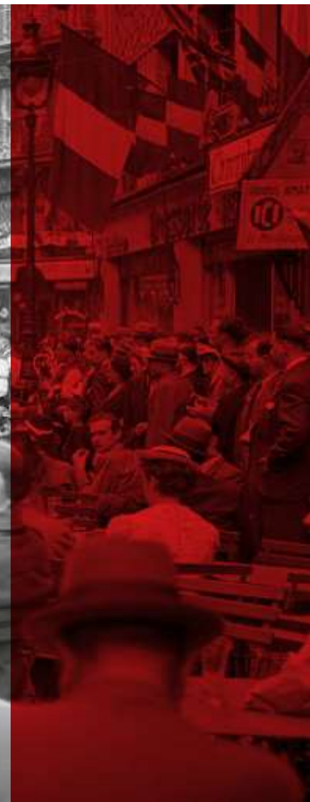
5. Robert Vishniac: Július 14-i utcaból Párisban, a Montemarton, 1939