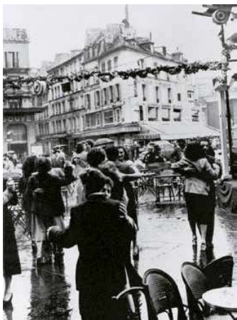
3. Utcaból Párisban, 1951. július 14. Archív fotó