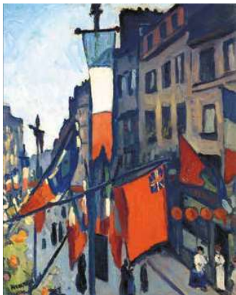
6. Albert Marquet: Július 14. Le Havre-ban, 1906