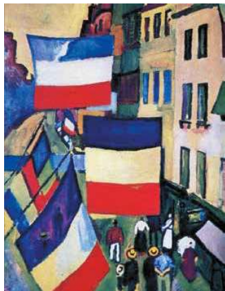
7. Raoul Dufy: Uta zászlókkal, 1906 Pompidou Központ, Párizs

A franciák egyik legfontosabb nemzeti ünnepét megjelenítő olajkép, a francia arts décoratifs kifejezés rövidített változatként ismertté vált art deco stílus szintiszta megnyilvánulása a művész életművében. „Pécsei korszakom lényege az impresszionizmustól távolálló plasztikus formabrázolás, kubisztikus szellemben. Szinte szoborszerűen formáltam meg figuráimat és mozgalmas kompozíciókba sűrítettem azokat” – nyilatkozta egy alkalommal művészetének erről a korai korszakáról.