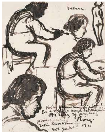
1. Rippl-Rónai József: Balzac Közlve: Herman Lipót: A zseni mosolya. Pesti Napló, 1928. december 25., 73. oldal