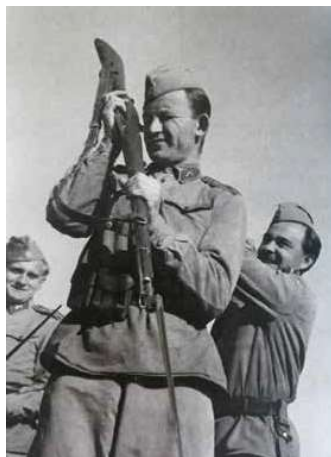
2. Kondor a katonaságban