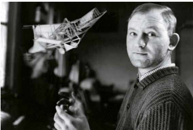
1. Kondor Béla konstrukcióval, 1960-as évek