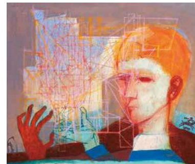
7 Kondor Béla: Férfi konstrukcióval, 1964 magántulajdon

Széles Klára szerint ez a kompozíciós séma a „ sajátos elmélyedés ürügye ”. 17 Varga Emőke ugyancsak ezt az olvasatot erősíti, amikor a látás, szemléllés, gondolkodás folyamatait összevonja a „ művész-léthez szubsztanciálisan ” tartozó alkotótevékenységgel Kondor műveiben. 18 Akárhogy is van, mind a kéz (annak cselekvése), mind a Másik jelenléte egy komplexebb viszonyt feltételez. Jelen esetben a jobb oldali alak a jobb kezével lefogja társának balkezét. Azt azonban nem lehet tudni, hogy a játékreplőt magáénak akarja, vagy az elrejtését akadályozza meg. Az önarckép jeleget erősíti a kézlefogás gesztusa, ahogyan a baloldali alak is a replőlével. Utóbbi egy Kondorról készült fotón, valamint a fényképet felhasználó festményen (ld. Férfi konstrukcióval , 1964), míg előbbi a Félszékény (1968) című profán oltszékényen köszön vissza.