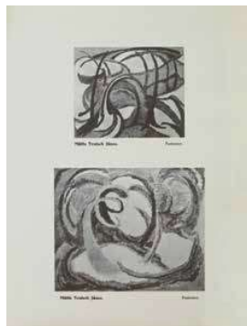
3. Mattis Teutsch festményeinek reprodukciói a MA 1918. novemberi számában