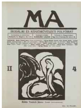
2. A MA 1917. februári száma Mattis Teutsch linómetszeteivel