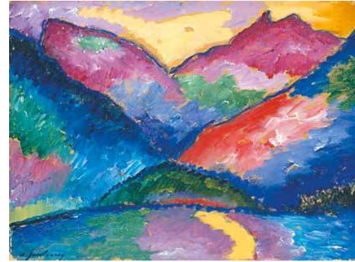
5. Alekszej Javlszskij: Az Oy völgye, 1912 Hamburg, Kunsthalle

egyaránt. Baloldali elkötelezettség vezérelte munkájában, azonban nem a forradalmi tett, hanem a gondolatok és ideák átadása és a társadalom organikus átforgatása volt a célja. Világnézetébe számos kortárs filozófiai és spirituális gondolatot is beépített. Művészetét az organikus és tudatos belső logika mentén felépített jellegéből adódóan egyik nemzetközi avantgárd irányzathoz sem rendelhetjük hozzá egyértelműen. Mattis Teutsch az 1910–1920-as években szoros együttműködésben dolgozott több olyan expresszionista