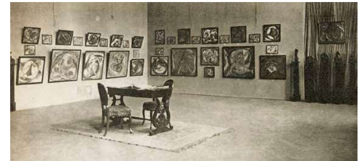
1. Enteriőr-fotó Mattis Teutsch brassói kiállításáról, 1919