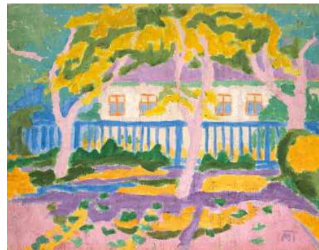
4. Mattis Teutsch szülőháza, 1908-1910 körül Sepsiszentgyörgy, Székely Nemzeti Múzeum

és konstruktivista csoporttal is, mint Kassák Lajos budapesti Ma folyóirata és galériája, a Herwarth Walden által vezetett berlini Der Sturm , a Novembergruppe , vagy a bukaresti Contimporanul , Punct és Integral folyóiratok. Ugyanakkor művészetét nem befolyásolták az adott csoportok manifesztumaiban megfogalmazott elvek: minden esetben az ő művészete találta meg a helyét az adott csoport elképzelései között. Művei ennek ellenére vizuálisan és tartalmilag is szoros párhuzamba vonhatók az avantgárd művészet nemzetközi irány-