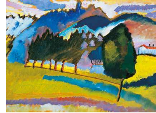
6. Vaszilij Kandinszkij: Tájkép, 1910 New York, Guggenheim Múzeum