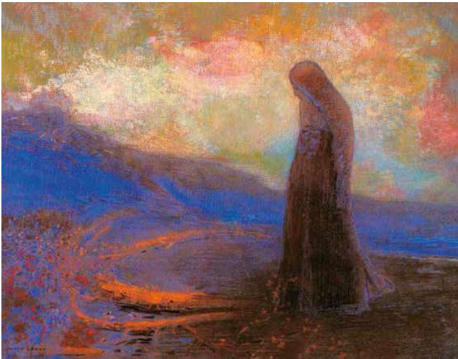
4. Odile Redon: Elmélikedés, 1900-1905 között magántulajdon