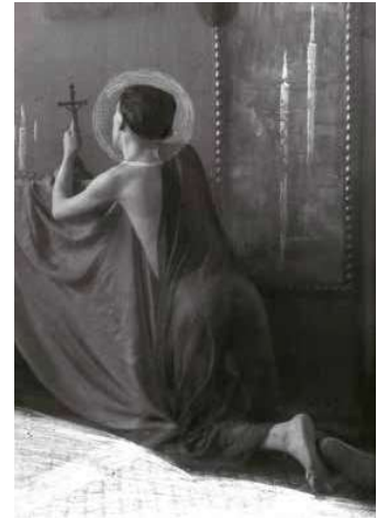
3. Gulácsy Lajos Szent Lajosként Rónai Dénes felvétele. Fotó: Magyar Fotográfiai Múzeum, Kecskemét