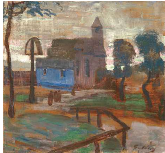
5. Gulácsy Lajos: Tájkép kolostorral magántulajdon