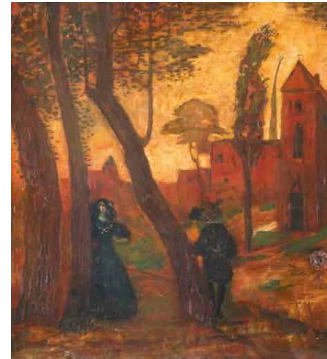
6. Gulácsy Lajos: Találkozás (Olasz mese), 1908-1909 között magántulajdon