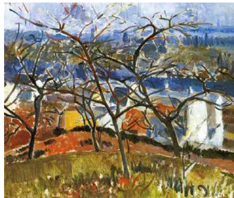
2. André Derain: Táj Chatou mellett, 1905 magántulajdon