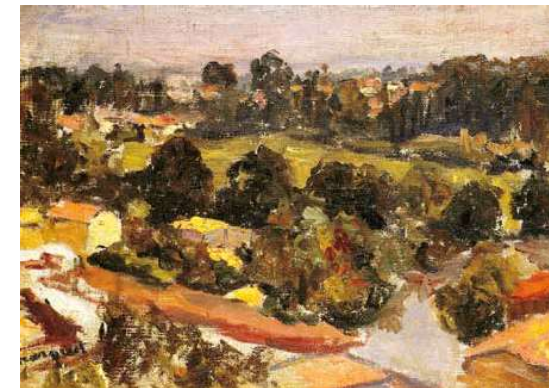
3. Albert Marquet: Párizsi külváros, 1897 magántulajdon