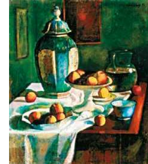
3. Czigány Dezső: Csendélet, 1920 körül Magyar Nemzeti Galéria, Budapest