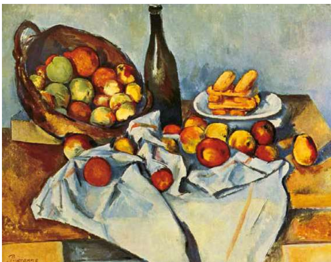
1. Paul Cézanne: Egy kosár alma, 1895 Art Institute Chicago, Chicago

Kezdő ár | Starting price: 18 000 000 Ft / 45 570 EUR Becsérték: 30 000 000 – 40 000 000 Ft Estimate: 75 949 – 101 266 EUR