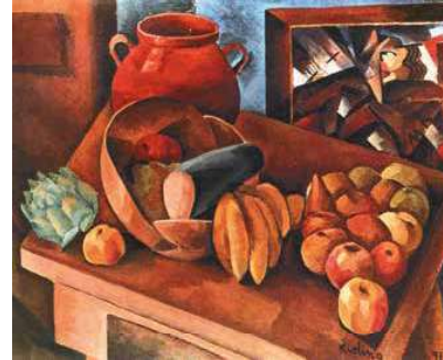
2. Moise Kisling: Csendélet gyümölcsökkel, 1913 Petit Palais, Genf