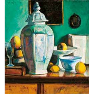
4. Czigány Dezső: Csendélet fedeles vázával, 1920 körül Magyar Nemzeti Galéria, Budapest

A közgyűjteményben lévő festmény és a most aukcióra kerülő kép tárgyegyüttese és komponálási módja hasonló, a festésmódjuk viszont egészen különböző. Míg a múzeumi darabon a hideg, mesterséges világítás figyelhető meg, addig a most felbukkant képen megjelenő tárgyak az ablakon beözönlő, intenzív nyári napsütésben pompáznak. Ennek megfelelően a festésmód is eltérő, a fényárban úszó tárgyak kontúrjai felolvadni látszanak, a nyári gyümölcsök pedig, kis túlzással szinte a néző szeme láttára érnek még zamatosabbá. A fény megpróbál birakra kelni a tárgyak Czigány által erőteljesen hangsúlyozott plasztikájával, és éppen ez a feszültség biztosít különleges ízt és egyedi jellemzőket, még az azonos műcsoporton belüli daraboknak is.