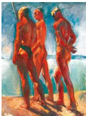
4. Szőnyi István: Patkó-Szőnyi-Aba-Novák, 1928 magántulajdon