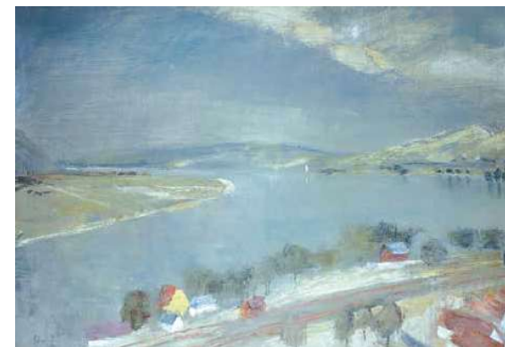
6. Szőnyi István: Szurke Duna, 1934 magántulajdon

„Zebegényben az évek során egész kis művészkolónia alakult ki, teljesen a baráti kapcsolatok alapján, semmiféle bürokrácia sem nehezedett azokra, akik Zebegénybe jöttek. Sokan a barátaim közül meglátogattak, megtetszett nekik a szép változatos vidék, kedvet kaptak a kinti munkára. Hosszabb-rövidebb időre kiruccantak dolgozni, voltak közöttük, akik azután állandóan letelepedtek Zebegényben. Kijött ide és telket is vett a váratlanul és korán elhunyt szegény Aba-Novák Vilmos, egy nyáron át itt dolgozott kitűnő jó barátom, Bernáth Aurél. Évekig kijárt nyaranta Szobotka Imre és kenyerespajtásom, Elekfy Jenő. De a leghűségesebben tartott ki Zebegény mellett, jóformán a haláláig, Berény Róbert barátom. [...] Sokat dolgoztunk, nagy problémákat feszegettünk, közben lejártunk az Ipoly és a Garam völgyébe, Esztergomba, s a jól eltöltött, derűs és több-kevesebb munka-