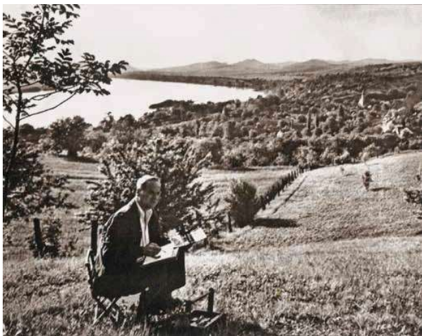
2. Szőnyi István zebegényi kertjében, 1954