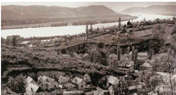
3. Zebegény látképe, 1940 körül