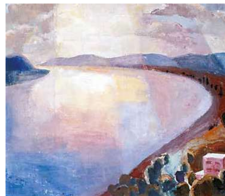
5. Patkó Károly: Zebegényi részlet, 1930 körül magántulajdon